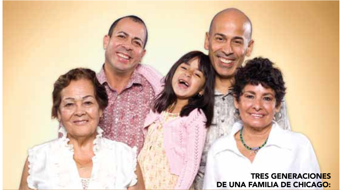
TRES GENERACIONES DE UNA FAMILIA DE CHICAGO: