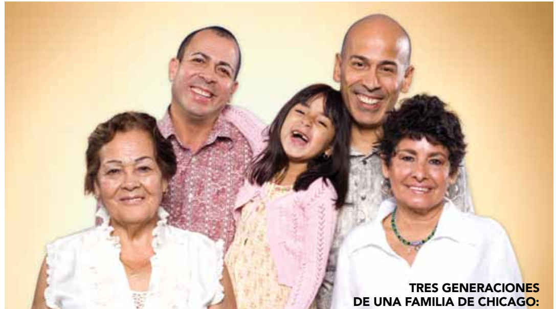
TRES GENERACIONES DE UNA FAMILIA DE CHICAGO: